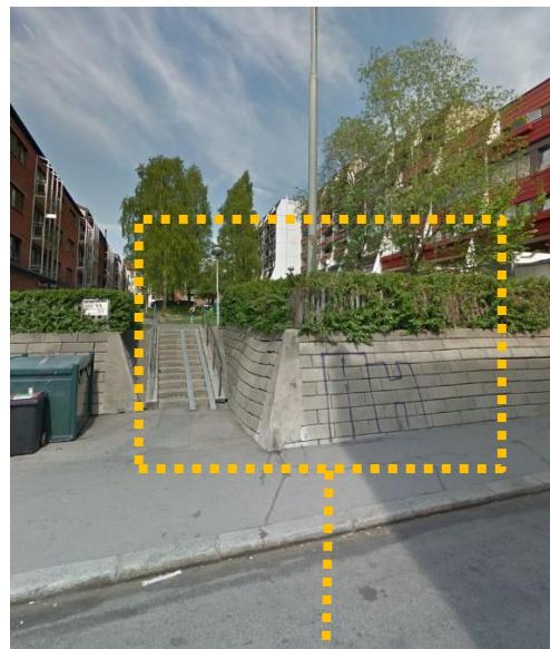
Anbefalt plassering for ny transformatorstasjon.